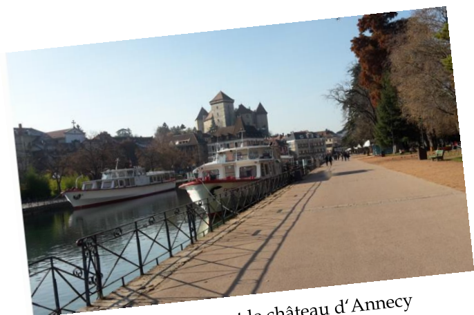
Le port de croisière et le château d'Annecy