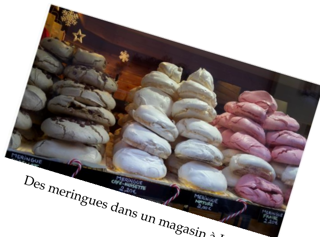
Des meringues dans un magasin à Lyon