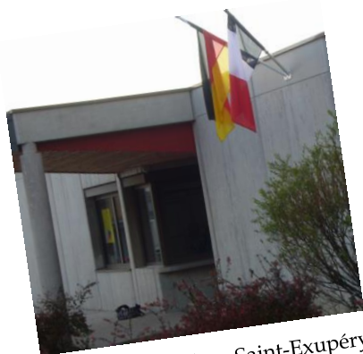
L'entrée du Collège Saint-Exupéry

Es lebe die deutsch-französische Freundschaft!